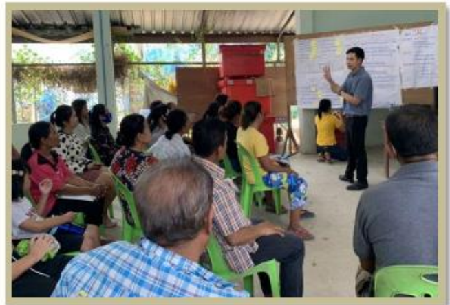
เข้าถึง: ระเบิดพลังความรู้ในชุมชน เพื่อสร้างปัญญา