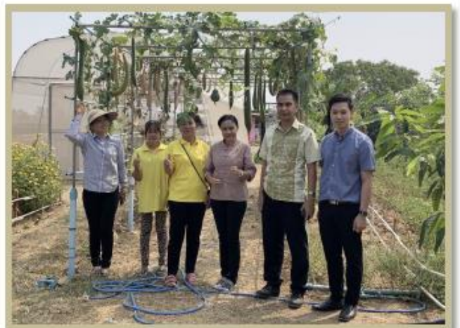
การมี Teamwork ที่ดี