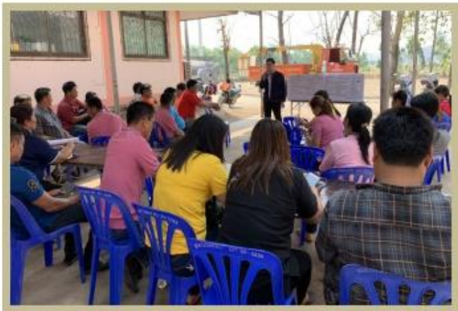
เข้าใจ: วิเคราะห์ทัศนียภาพชุมชนในพื้นที่ร่วมกับผู้นำชุมชน