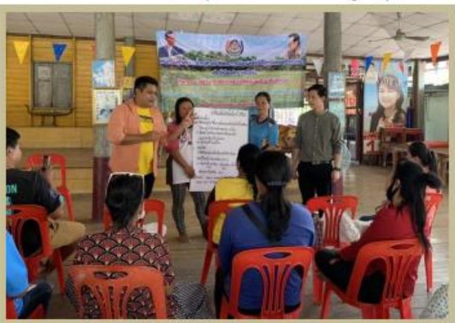
พัฒนา: ชุมชนพึ่งพาตนเองได้